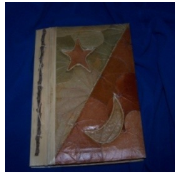
Sonne, Sterne singt..